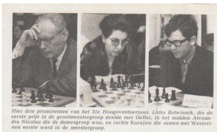
Hier drie prominenten van het 31e Hoogoventoernooi. Links Botwinnik, die de eerste prijs in de grootmeestergroep deelde met Geller, in het midden Alexandra Nicolau die de damesgroep won, en rechts Kurajica die samen met Westertenen eerste werd in de meestergroep.

De taakstelling omtrent het ledental van de KNSB mikt ambitieus op een aantal van 25.500 in 1973, een toename van 9000 leden ten opzichte van 1969. De NHSB telde op 1 augustus 1968 1644 leden en was daarmee de 4 e in grootte, na SGS (2132), RSB en HaSB.